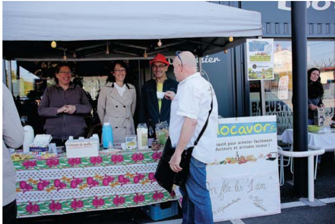
L'accueil des clients devant le Fournil de Camille à Tain.